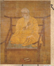
1章 No.12 重要文化財 ※前期展示 真言八祖像 京都・神護寺 鎌倉時代(12~13世紀)