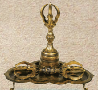
★3章 No.57 国宝 金銅密教法具 京都・教王護国寺(東寺) 中国・唐(9世紀)