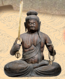
1章 No.11 重要文化財 不動明王坐像 和歌山・正智院 平安時代(9世紀)