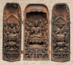
3章 No.55 国宝 諸尊仏龕 和歌山・金剛峯寺 中国・唐(7~8世紀)