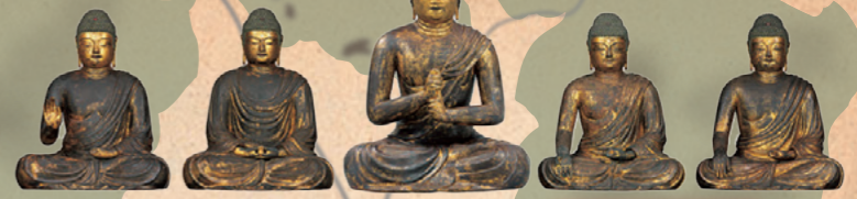
★1章 No.2 国宝 五智如来坐像 京都・安祥寺 平安時代(9世紀)