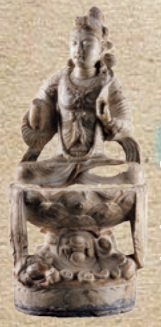
★3章 No.48 一級文物 文殊菩薩坐像 中国・西安碑林博物館 中国・唐(8世紀)