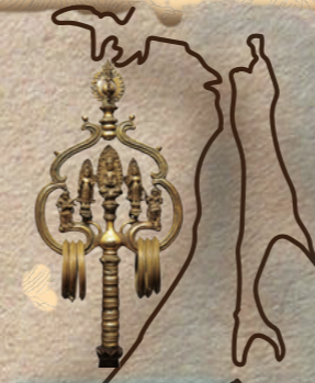
★3章 No.58 国宝 錫杖頭 香川・善通寺 中国・唐(9世紀)