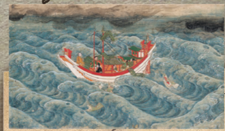
3章 No.42 重要文化財 弘法大師行状絵詞 卷第三 ※後期展示 京都・教王護国寺(東寺) 南北朝時代 康成元年(1389)