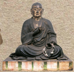
1章 No.1 重要文化財 弘法大師坐像 奈良・元興寺 鎌倉時代(13~14世紀)

ミッション1 マップの作品のうち、★がついたものを 展示室でさがそう！(作品番号が手がかりだよ) 作品の横にあるこども解説で、 ざんまいずが持っている漢字一文字を マップの中の□に書き入れよう！