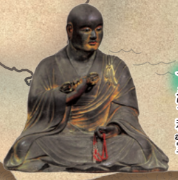
★5章 No.115 弘法大師坐像(萬日大師) 和歌山・金剛峯寺 室町~安土桃山時代(16~17世紀)