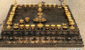
★1章 No.6 重要文化財 南都大壇具 奈良・室生寺 鎌倉時代(14世紀)