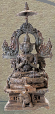
★2章 No.27 金剛界曼荼羅彫像群 インドネシア国立中央博物館 インドネシア・東部ジャワ(10世紀)